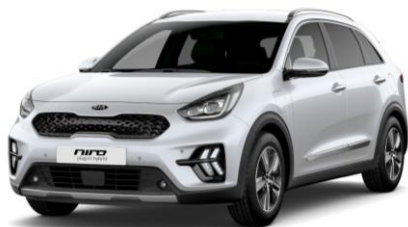
Snow White Pearl