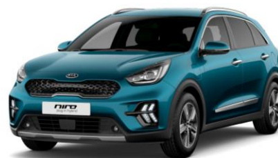
Deep Cerulean Blue