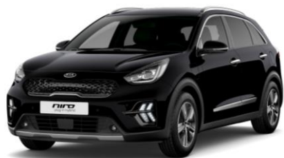
Aurora Black Pearl